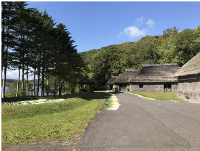
▲9月、トドマツと伝統家屋(中央奥ではゴザの材料のガマを干す)

一方、アイヌ民族博物館の敷地内にもミズキやカツラなどの広葉樹や、イチイやトドマツなどの針葉樹が合わせて20種類以上あります。湖畔の自然に溶け込むように伝統家屋が並ぶ景観は、アイヌ文化を紹介する野外博物館の重要な展示要素の一つであり、踊りや展示とともに、来館者の記憶に残っていることと思います。