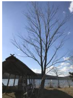
▲丸木舟を作るカツラ

物語を読んでから、かつてのアイヌの支点で森を歩くと、樹木が語り合っているかのように感じられ、より深く自然を楽しむことができます。