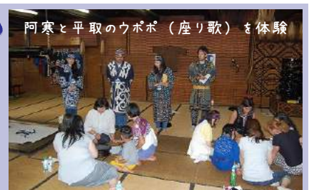
阿寒と平取のウポポ(座り歌)を体験