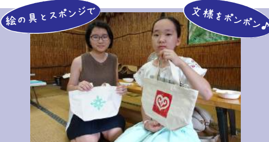
絵の具とスポンジで