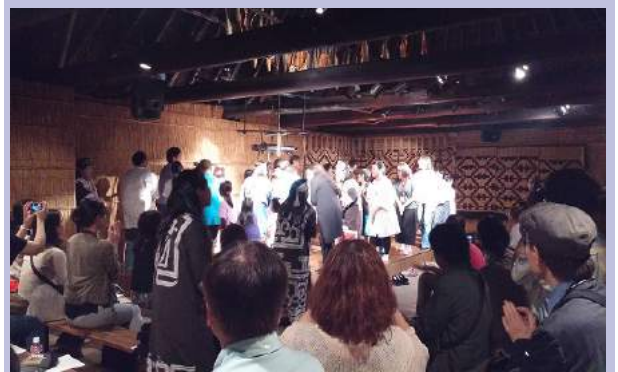
演目最後の踊りでは会場のみながひとつに

「ポロトコタンの夜」では、公演前に学芸課職員による博物館ガイドツアーが行われ、その後チセの中で伝統的な祈り、歌・楽器・古式舞踊の公演、サッチェブ(干し鮭)に関する食文化の紹介と、よりアイヌ文化を体感していただけるプログラムを行っております(当館ホームページで当日の様子をご覧ください)。今年は新たに口承文芸を演目に取り入れ、アイヌに伝わるホタルの物語の冒頭をお聞きいただきました。