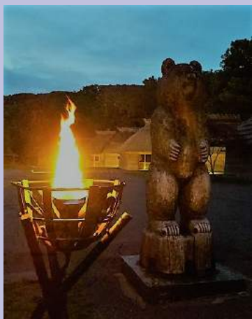
かがり火が灯る幻想的な夜

2003年より今年で15年目となる当プログラムも、今年でファイナルとなりましたが、最後の公演もたくさんのお客様にご来場いただき、会場のチセ(伝統的家屋)は満席となりました。