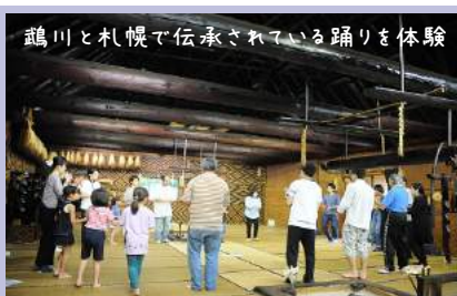
鶴川と札幌で伝承されている踊りを体験

また期間中には、当館職員によるイベント「第3回アイヌ文化教室 古式舞踊にふれよう!」、「アイヌ文様を作ろう!~絵の具編~」や、伝承者(担い手)育成事業第四期生による公開講座「アイヌ語でうたおう!~ウポポ・アイヌの座り歌~」も開催し、いずれも定員を超えるお客様にご参加いただきました。