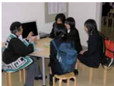
調べ学習のようす

そのほか、昼食には伝統料理のオハウやイナキビご飯を食べ、食文化を体験していました。