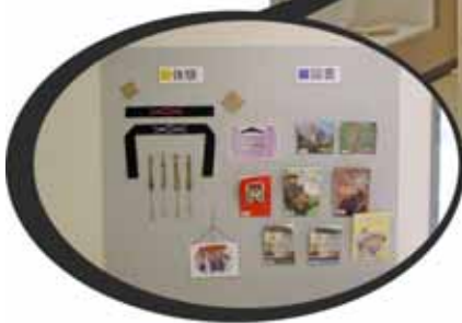
体験用ムックリや絵本