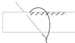
図 切り伏せのまつり方

2-古い着物の多くは、糸目が「ノ」の字に出ている。 ※イカワリ(コーフステッチ)も同様。