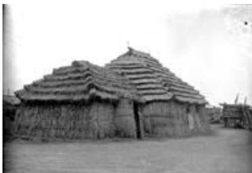
写真1 資料番号90007

いずれにせよ推測の域を出ない。この写真を見てピンときた方は、ぜひご教示願いたい。