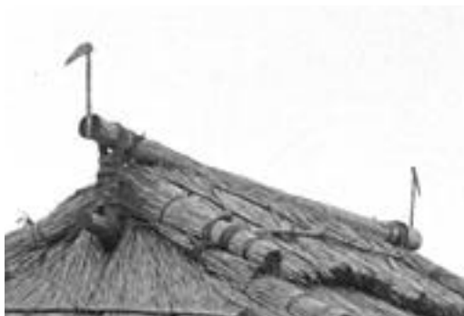
写真2 資料番号90007拡大