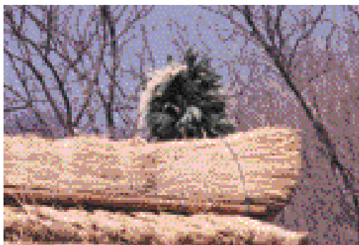
写真3 ポロチセのタクサイナウ

ポロチセの新築祝については、アイヌ民族博物館『伝承事業報告書 ポロチセの建築儀礼』（2000年3月刊行 p.8「新刊紹介」）参照。