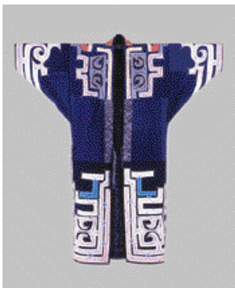
複製したルウンベ（河岸麗子作）

原資料は児玉コレクション。複製の過程で、昭和9年、30年に木下清蔵氏が撮影した複数の写真に同資料が着用されていることが分かり、それまで来歴不詳だった資料の収集地・使用歴・補修歴などが判明した。（3・4頁）