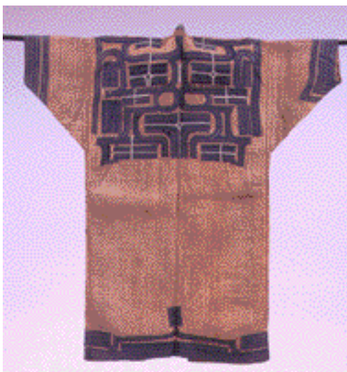
アットゥシ (樹皮衣)