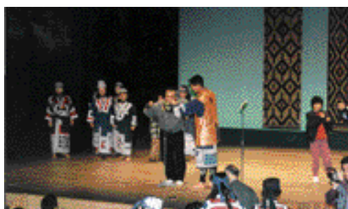
ムックリ演奏体験