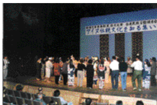
全員でイヨマンテ