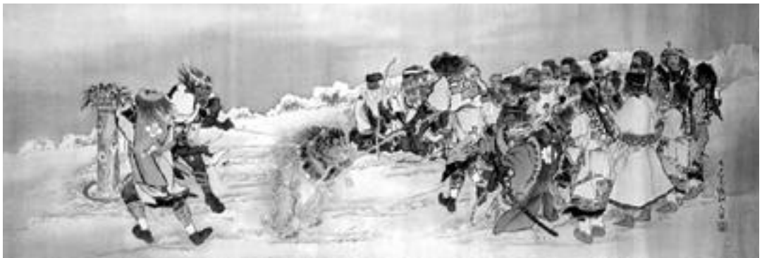
木戸竹石「アイヌ熊狩之図」(アイヌ民族博物館蔵)